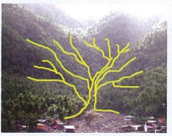
Guhit na nagpapakita ng sanga-sangang ilog at sapa na may panganib sa flashflood

Ang isang komunidad sa Pinut-an, Panaon Island sa Leyte na dinaanan ng flashflood noong Dec. 2003 at ang mga sanga ng sapa sa kabundukan