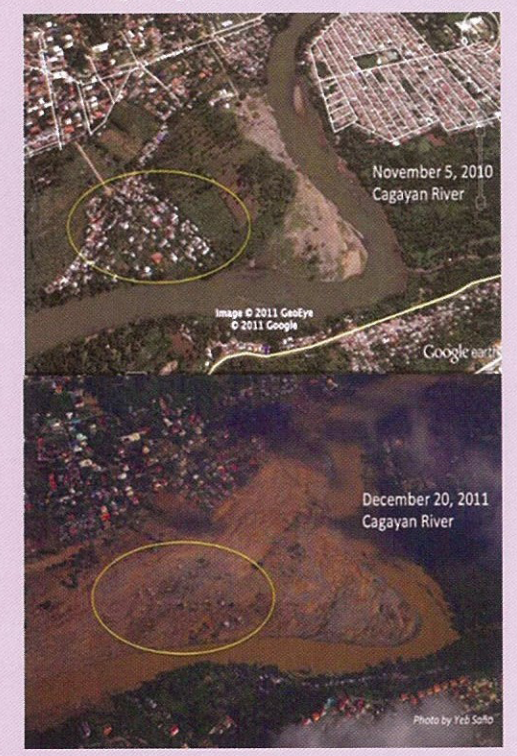
Mga larawan bago (itaas) at pagkatapos (ibaba) maganap ang baha na dala ng Tropical Storm Sendong sa Barangay Macasandig, Lungsod ng Cagayan de Oro noong Disyembre 2011. Ang lugar na binllugan ay nasa isang 'point bar deposit' na nabuo dahil sa pagkaipon ng mga sediments na dala ng ilog. Hindi dapat tumitira ang tao sa ganitong mga lugar na may matinding panganib sa baha. Pinapakita sa larawan ang malaking pinsalang dulot ng baha. Nawasak halos lahat ng mga kabahayan at mahigit isang daang tao ang namatay.

Ang flood o baha ay ang pag-apaw ng sobrasobrang tubig sa natural nitong daluyan, tulad ng sapa, ilog at dagat, dahilan upang malubog ang nakapalibot ditong lupa.